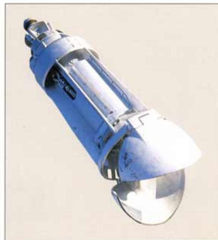
● 堅牢なグラブバケット