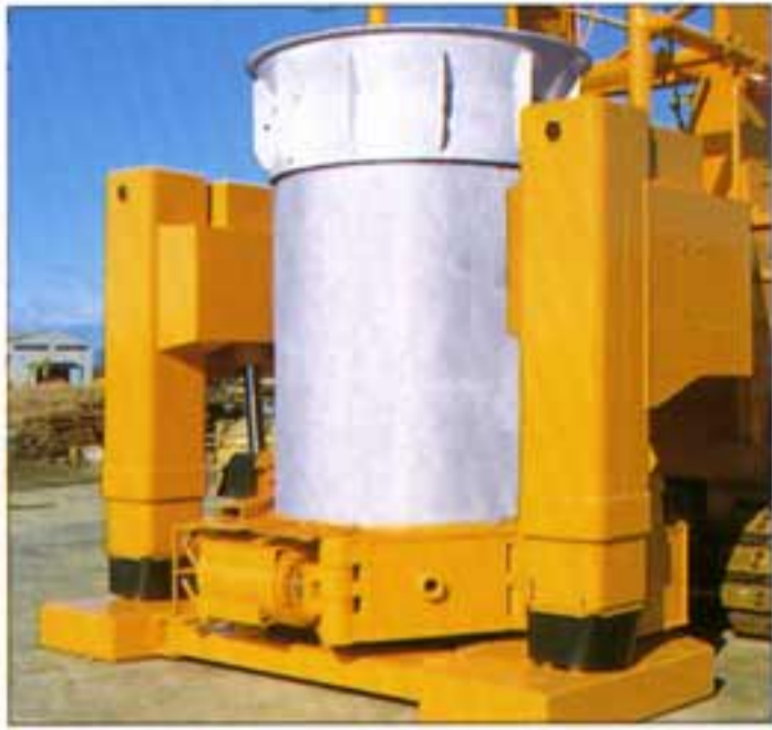
● 芯出し、強力な掘削揺動装置