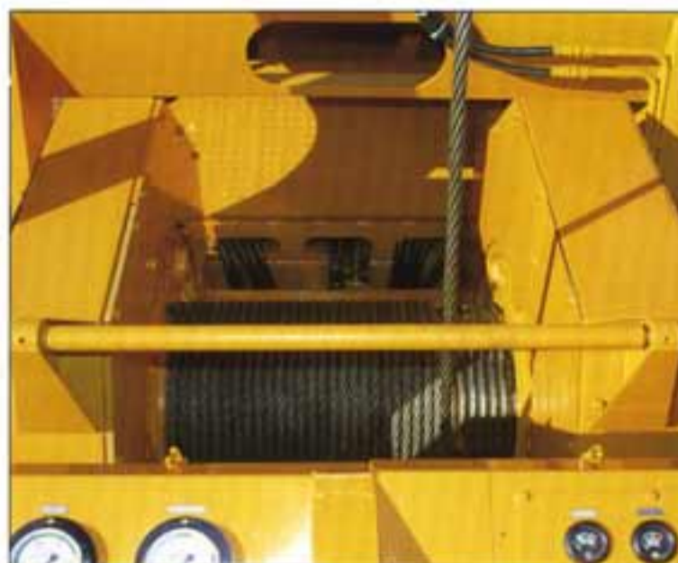
● スピーディなウインチ