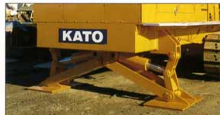
● 揺動反力に強いリヤ・アウトリガ