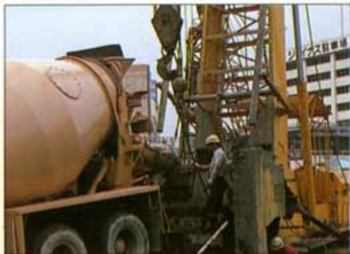
● 生コンクリートの打設