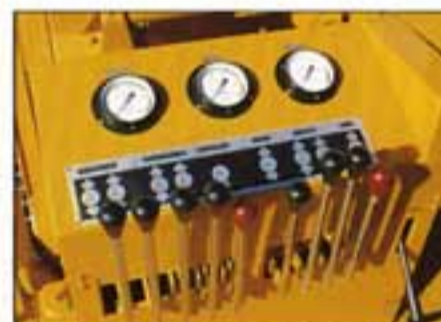
● 操作のしやすい揺動コントロールレバー