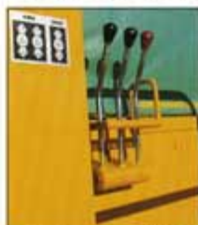
● 視界の広い走行レバー