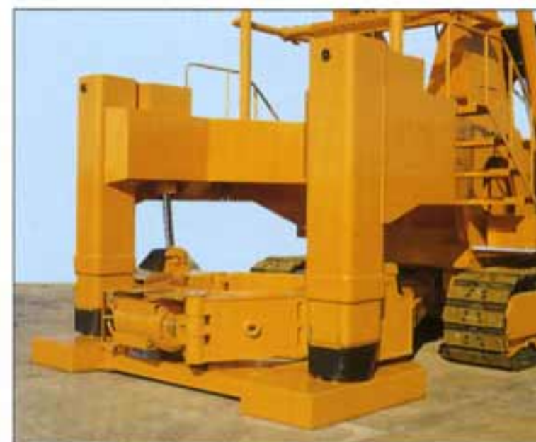
● 堅牢なフロント・アウトリガ